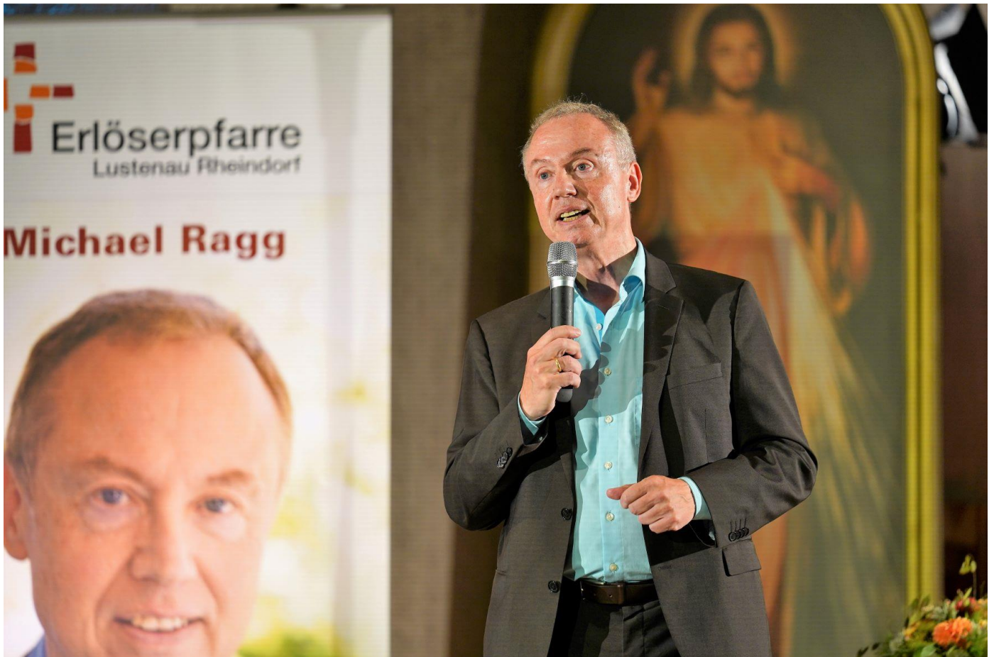
Vortrag in Lustenau/Vorarlberg