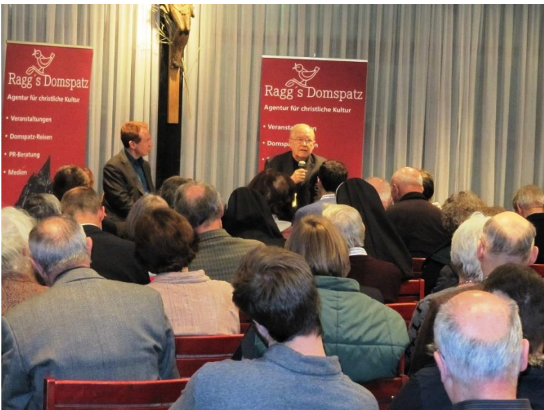
Kardinal Paul Josef Cordes auf der Domspatz-Soirée in München

Zum Tod von Kardinal Paul Josef Cordes am 15. März zeigte EWTN erneut die Aufzeichnung einer Münchner Domspatz-Soirée mit dem Kurienkardinal aus dem Jahr 2015.