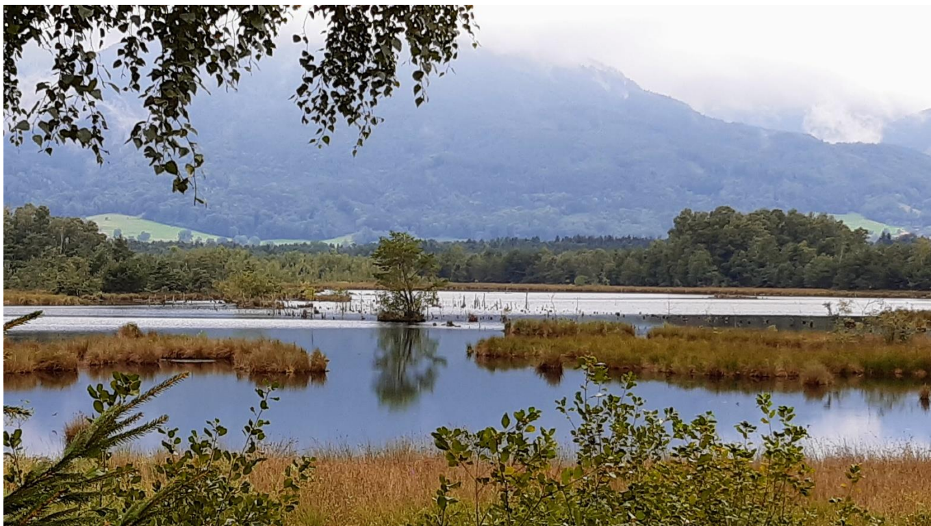
Blick auf die Rosenheimer Stammbeckenmoore – Klarheit, Harmonie und Schönheit erleben wir immer öfter, wenn uns heilsame Gedanken im Alltag begleiten