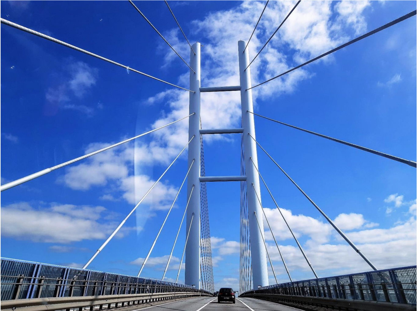
Die Rügenbrücke, ein neues Wahrzeichen Stralsunds, verbindet Deutschlands größte Insel Rügen mit dem Festland. Auch die Tourismus-Pastoral an der Ostsee ist eine Brücke – von Gott zu den urlaubenden Menschen

Radio Horeb ist empfangbar via Livestream, Satellit Astra, bundesweit über DAB+ und in vielen Kabelnetzen.