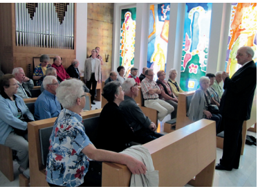
Offene Türen: Unsere Pilger in der Kapelle der Apostolischen Nuntiatur

so viele Menschen strömen jetzt nach Berlin, aber nur wenige entdecken das Herz dieser pulsierenden Stadt. Selbst für den Berliner Kultur-Staatssekretär ist die deutsche Hauptstadt nämlich „europaweit vielleicht die Stadt, in der sich die meisten Menschen für Religion engagieren“. Auf unserer Pilger-Studienreise entdecken Sie in der vermeintlichen kirchlichen Wüste Oasen des Glaubens, „einladende, anziehende, fruchtbare Oasen ... Suchen wir diese Oasen. Sie sind zu finden!“ (Kardinal Sterzinsky).